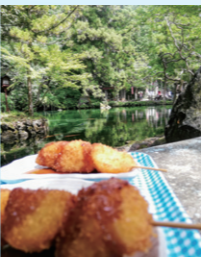
『花より団子？ いいえ、どちらも』