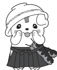
佐野ブランドキャラクター さのまる ©佐野市