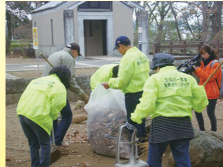
『栃木県シルバー大学校南校同窓会佐野支部 きれいな佐野づくり推進活動』