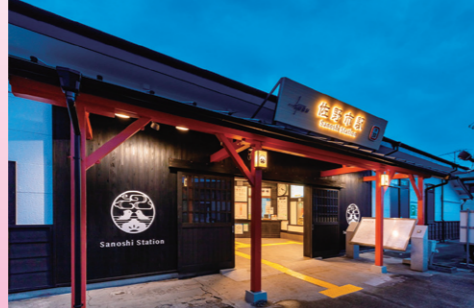
『東武佐野線佐野市駅』