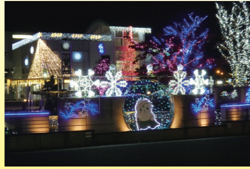
『佐野駅前交流プラザばらぼーと Fantastic Illumination Sano』