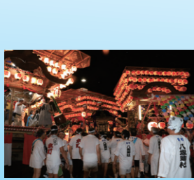
『八坂神社祇園祭り』