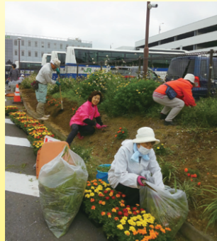
『緑化クラブばなばな 緑化ボランティア活動』