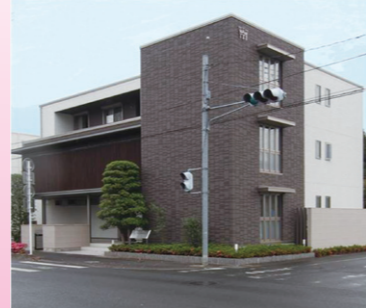
『Maison de SERA』