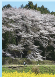
『里山の春に 包まれて』