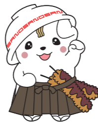
佐野ブランドキャラクター さのまる © 佐野市

〒327-8501 佐野市高砂町1番地 佐野市役所 都市計画課 計画係 TEL：0283-20-3100/FAX：0283-20-3035 E-mail：toshi@city.sano.lg.jp