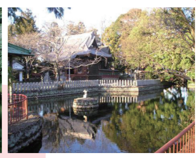
『人丸神社の湧水池』