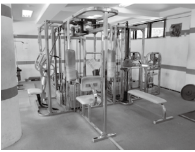
▲佐野市運動公園陸上競技場内のトレーニング室

☆出流原PA周辺総合物流開発整備事業について ☆小中学校の外国人受け入れに関し、その教育環境整備について