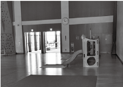
▲佐野市こどもの国総合こどもセンター内の遊具