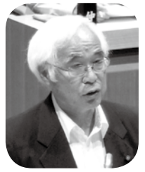
質問方式 一問一答