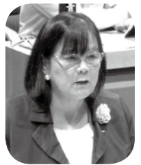
質問方式 一問一答