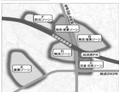
▲ 出流原PA周辺総合物流開発整備に関する基本構想書より