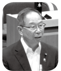
質問方式 一問一答