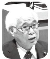
鶴見 義明 議員(日本共産党議員団) 質問方式 一問一答 災害時対策について

Q 自主防災会の組織は基本的には町会単位となっていて、地域によっては町会自体の運営が厳しい状況のところもあるのではないかと懸念している。自主防災組織を立ち上げたものの、結果的には人のいない状況で活動が困難になり、活動停止や自然に消滅をといったような状況にもなりかねないが、そのような防災組織の実例はあるのか。