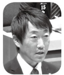
横田 誠 議員(新風) 質問方式 一問一答 高齢者、障がい者、困難を抱えた若い世代の見守りについて

Q 多くの自治体で、孤独死を防ぐため、市民の意識啓発も兼ね、緊急通報に関する連絡先などを掲載したリーフレットを作成し配布しているが、本市でも同様の取り組みができないのか。また、リーフレットを配布する場合は対象や範囲をどのように考えるのか。