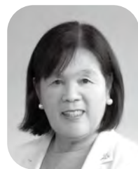
岡村 恵子 議員(日本共産党議員団)

障害者支援施設とちのみ学園 職員の支援策を子ども子育て 支援施設職員の支援策について