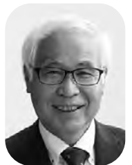
鶴見 義明 議員 (日本共産党議員団)

一般に、本来大人が担うと想定されている家事や家族の世話などを日常的に行っている子どものこと