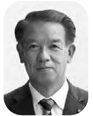
木村 久雄 議員 (公明党議員会)