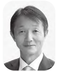
すがわら 菅原 達 議員 (公明党議員会)