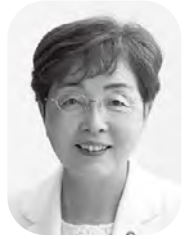
たきた ようこ 滝田 洋子 議員 (日本共産党議員団)