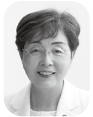
滝田 洋子 議員