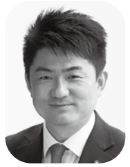
早川 貴光 議員