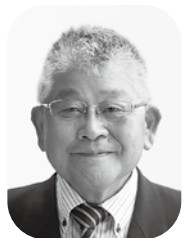
飯田 昌弘 議員