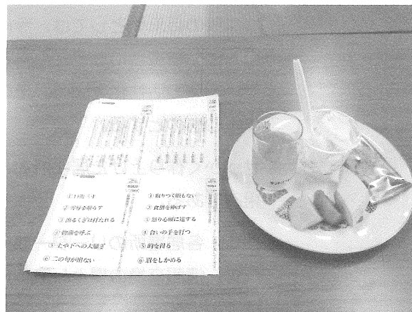
お茶菓子とフルーツなどを食べながらつろぐ時間も。