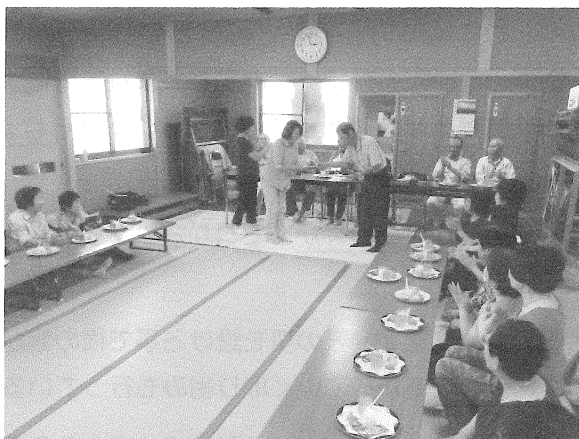
毎月誕生月のメンバーにお祝い品と唄のプレゼント。