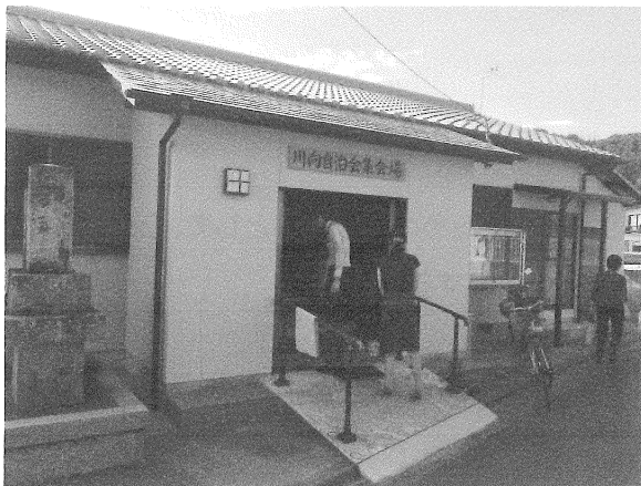
地域の集会所が居場所。皆さん歩いて来ます。

市役所での説明を終え、午後からは 232 箇所の居場所の中で、『久米山げんき会』を市の担当職員と一緒に現地視察し活動に参加させていただいた。（その様子は下記写真を参照）