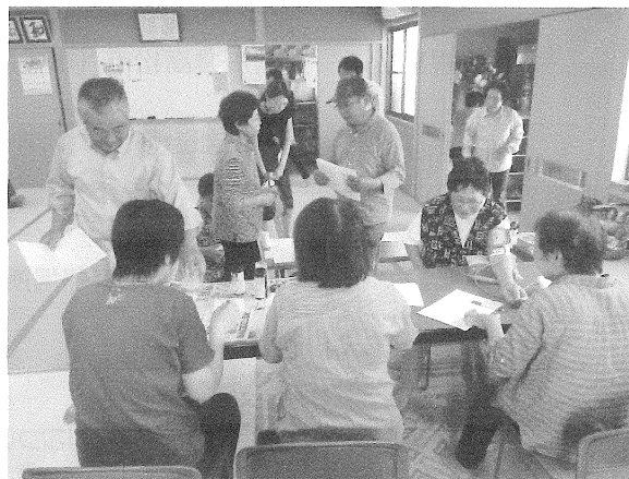
毎月 1 回健康チェック（尿・血圧等）を行っています。