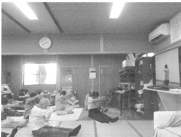
施設整備助成費で購入したモニタ見ながら体操を！