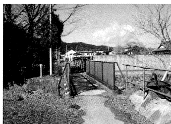
旧葛生保育園東側