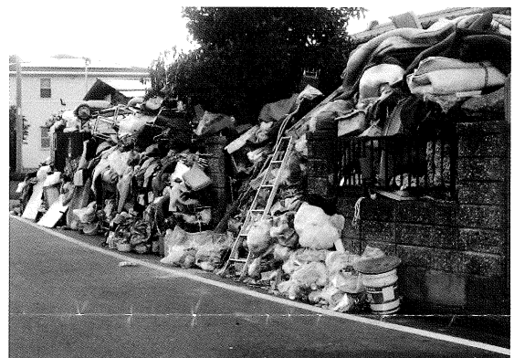
側溝の上にはみ出している

多くの自治体で条例の制定を進めているが、本市としてはどのように考えているのかにつきましては、ごみ屋敷対策条例を制定している市や区の実情を見ますと、当該市区内においてごみ屋敷と言われる事案が数十件から 100 件を超えるという状況があり、その対応のため制定されたと考えられます。現在のところ条例の制定は考えておりませんが、今後ごみ屋敷対策条例について調査研究してまいりたいと考えております。条例を制定する場合は、きれいなまちづくり条例を改正して定めることも含めまして検討してまいりたいと考えております。悪臭や害虫の発生など周辺の環境に与える悪影響や火災防止への対策につきましては、昨日もごみ屋敷の近隣の方からご連絡をいただき担当職員のほうで現場に赴きまして、本人の方は不在で直接指導はできませんでしたが、飛散したごみの回収等を行ってきたところで、このごみ屋敷の原因者に対しましては、苦情があった場合にはその都度そのほか必要に応じて訪問しまして、警察の協力もいただきながら、ごみを片付けるよう繰り返し指導を行ってきたところでございます。今後も解決に向けて警察とも十分連携を図りまして粘り強く指導を行ってまいりたいと考えております。ごみ屋敷という問題は大変重要な、大変な問題だという認識は十分にしております。