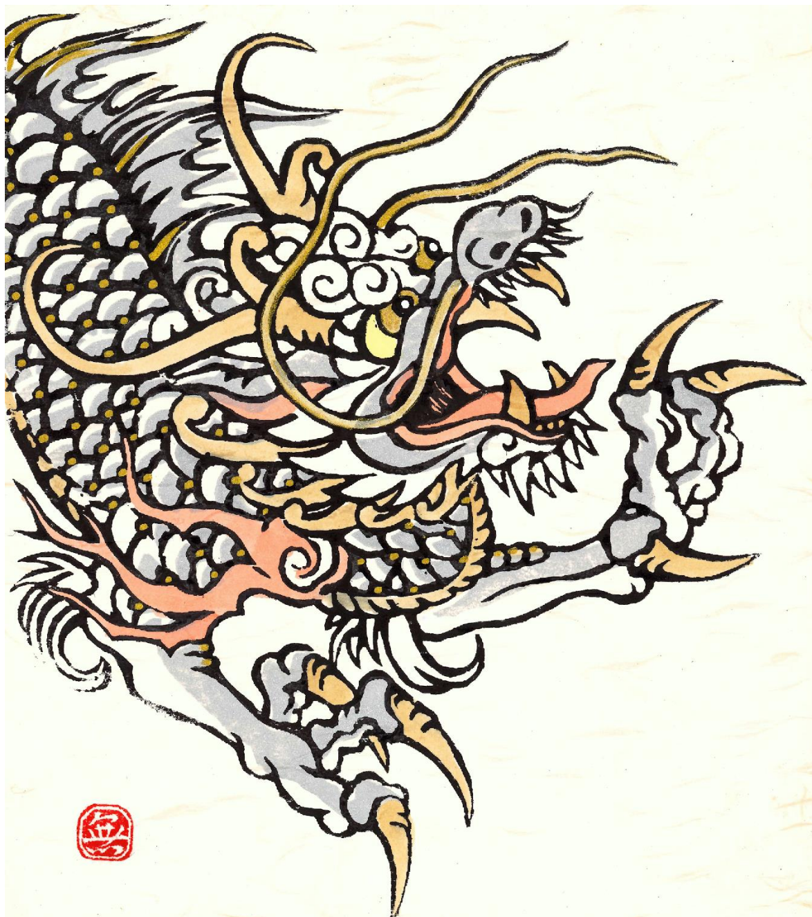
「竜掴」 笹川むもん氏作