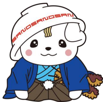
佐野ブランドキャラクター さのまる©佐野市