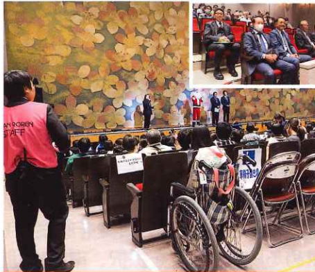
第49回クリスマスチャリティー公演 2025日産労連NPOセンター「ゆらいふ21」主催の第49回クリスマスチャリティー公演が開催され、1,500人をこえる来場がありました。皆様のお陰でたくさんの笑顔に出会うことができました。ありがとうございました。