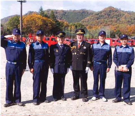
令和7年度佐野市消防団通常点検 KOUNOIKE グリーンスポーツフィールドにおいて佐野市消防団通常点検がおこなわれました。地域の安心・安全のために真剣に活動されていることに、心より感謝申し上げます。