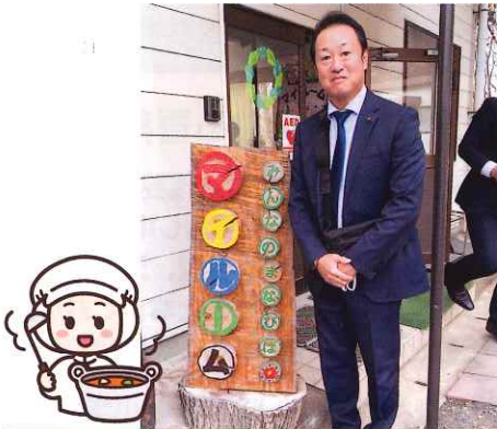
義務教育学校・給食センター・教育施設の見学会 佐野市議会の研修で「佐野市立あその学園義務教育学校」・「佐野市立北部学校給食センター」・「みんなのまなびばマイルーム」を見学してきました。