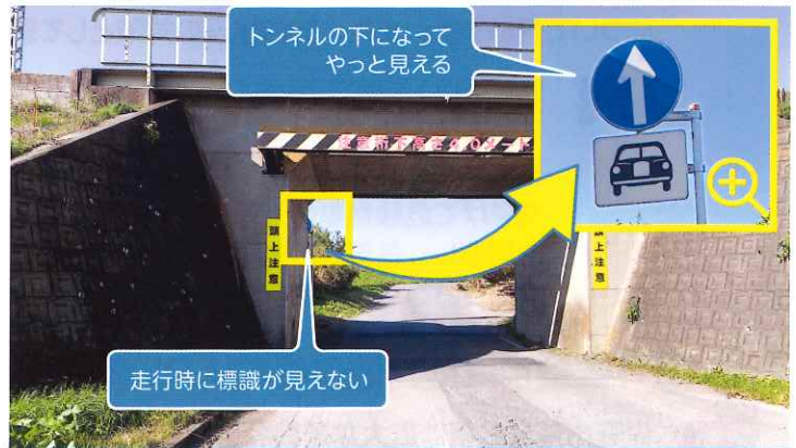
道路の標識について 道路の標識が見えないので改善して欲しい。 →市の道路河川課に要望したところ、所管が栃木県公安委員会（佐野警察署内）とのことでした。市から栃木県公安委員会に対し改善要望をしていただき、検討中です。