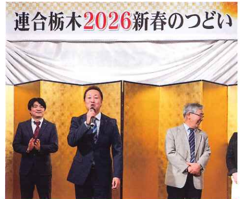
連合栃木2026新春のつどい 連合栃木 2026 新春のつどい 連合栃木「2026 新春のつどい」が開催され一言ご挨拶させていただきました。