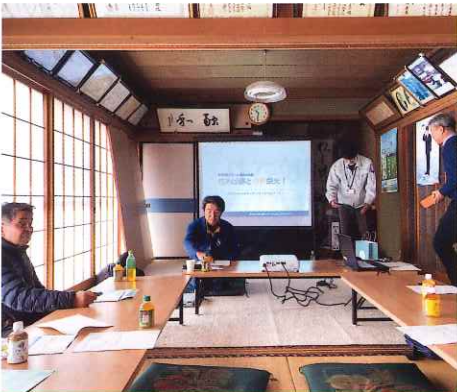
佐野市多目的機能支払交付事業の視察研修会 栃木県鹿沼市の板荷畑地区にて開催の、担い手農家の不足、高齢化による耕作放棄地の拡大といった課題解決の先進地域の研修に参加しました。これからの活動に活かしていきたいと思います。