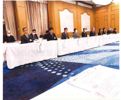
佐野市への政策・制度要求と提言に対する回答交渉 連合栃木わたらせ地域協議会から佐野市に対し提出した「政策・制度要求と提言」についての回答交渉を行いました。皆さま、ありがとうございました。