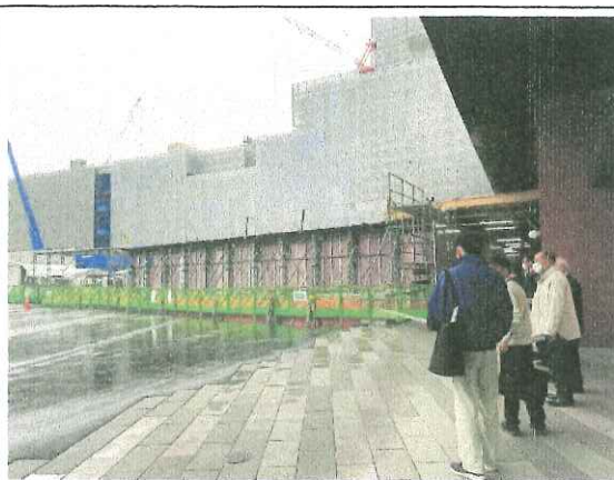
・長崎市駅周辺再整備事業現場