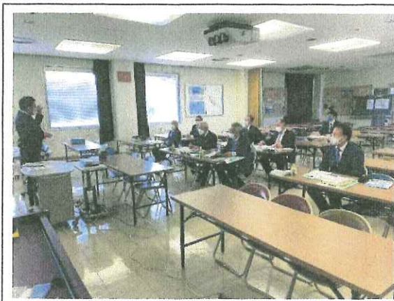
・事業説明の様子(大村市)