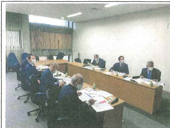
・事業説明の様子(長崎市)