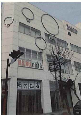
佐賀パルーンミュージアム

回答:令和2年度375万9千円。令和3年度339万9千円。令和4年度304万5千円。