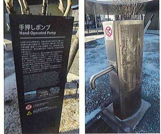
熊本駅前の手押しポンプ

熊本市は、世界でも珍しい全世帯に地下水の水を供給しております。大地震には水道ポンプが活躍したそうです。