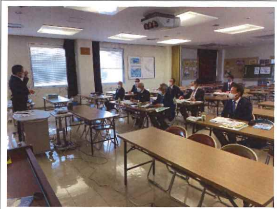
・事業説明の様子(大村市)