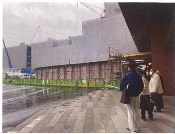
・長崎市駅周辺再整備事業現場