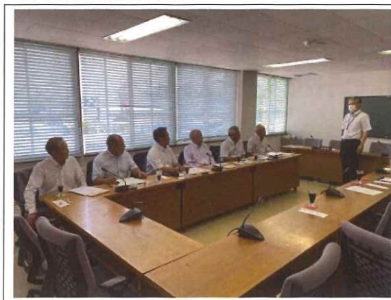
・意見交換会の様子