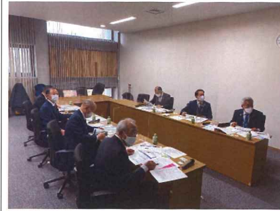
・事業説明の様子(長崎市)