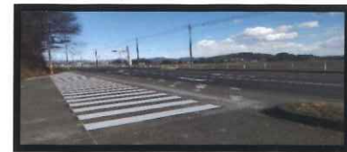
出流原西 交差点に 横断歩道