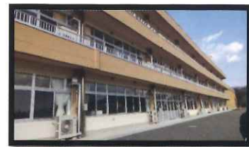
← 葛生義務 教育学校 (令和5年 4月開校)