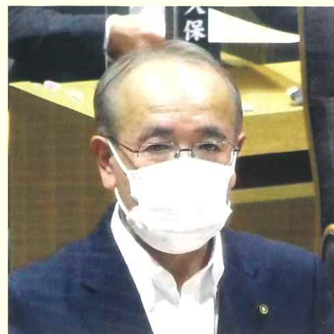
定例議会にて一般質問を行う