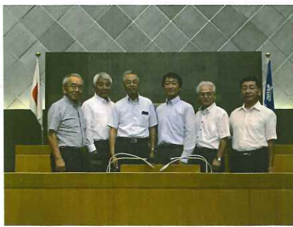
高岡市 たかおかストリート構想 委員会視察