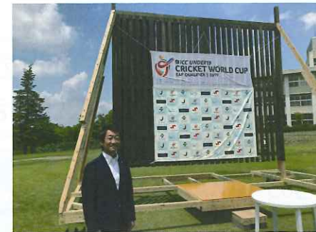
ICC U19 ワールドカップ 東アジア予選 見学