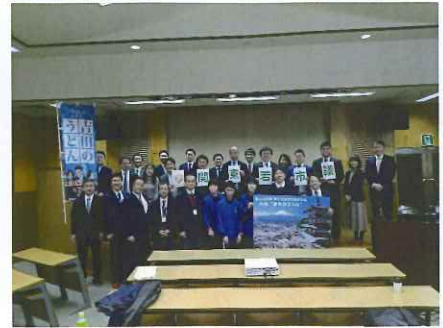
富士吉田市 ひばりが丘高校 うどん部の取組み 若市議研修