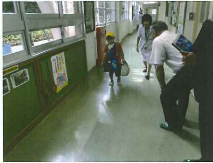
福岡市 東住吉小医療的ケア児 会派視察