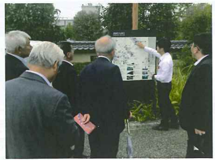
富山市 コパの外なまちづくり 委員会視察