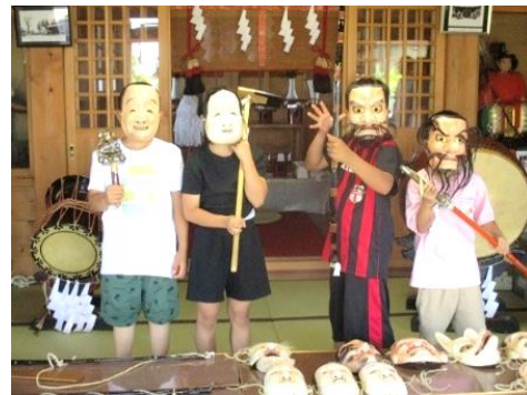
地域探検(八幡神楽)