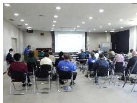
葛生化石館企画展関連講演会