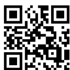
佐野市郷土博物館