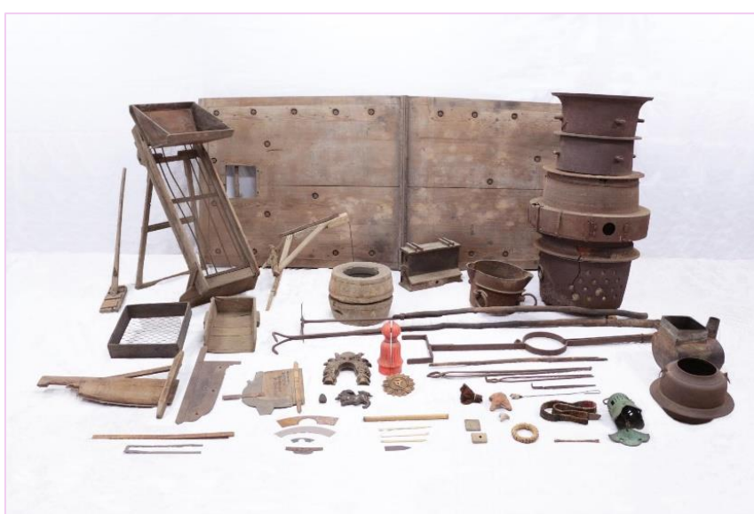
佐野の天明鋳物生産用具及び製品