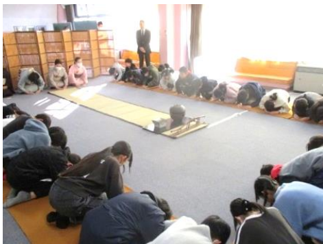
天明鑄物を使った茶道体験