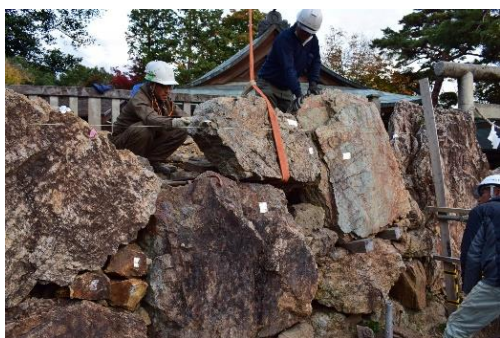
令和4（2022）年度石垣積み直し工事