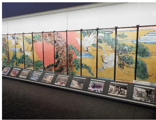
牧歌舞伎舞台の襖絵