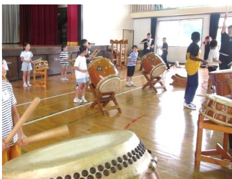
佐野秀郷太鼓の体験