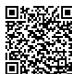
佐野市ホームページ 【唐沢山城跡】