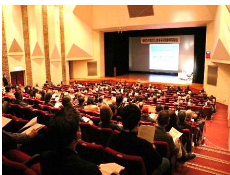
唐沢山城跡保存整備事業に伴う講演会