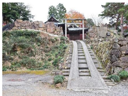
唐沢山城跡本丸西虎口北側石垣