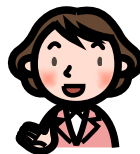
被害児童生徒のフィルタリング利用状況

フィルタリングの設定をしていれば、被害を未然に防げた可能性があったともいえます。