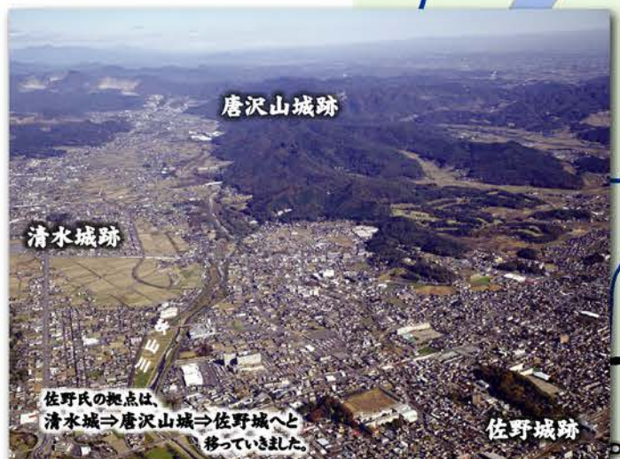
佐野氏の拠点は、清水城⇒唐沢山城⇒佐野城へと移っていました。

徒歩の時間は、40代の女性が実際に歩いて計測したものです。休憩時間は含まれていません。このパンフレットに関する問合せ先は、佐野市文化財課【0283-61-1177】