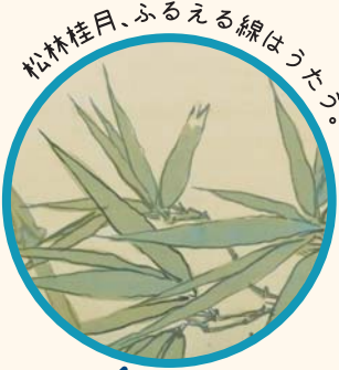
松林桂月、ふるえる線はうたう。