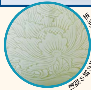
板谷波山、八十九歳 の菊の線