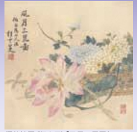
須藤桂雲(鞆音兄)「風月三昆図」 「桂雲画帖」より、明治7年(1874)*【前後期場面替】