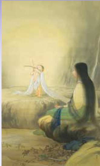
小林古径(神崎の窟) 吉澤コレクション【後期展示】