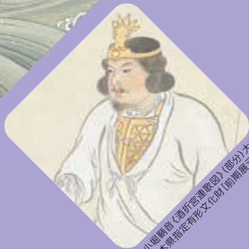
小堀騎音「源氏宮内卿」(部分)大正8年(1919) 栃木県指定有形文化財[前期展示]