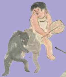
小堀騎音「色紙[金太郎]」(部分) [前期展示]