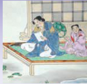
小堀鞆音(宇治大納言隆国卿)(部分)*【前期展示】