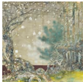
福島恒久《歳寒三友図》2023年 個人蔵[通期展示]