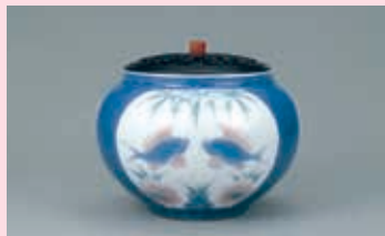
板谷波山《彩磁呉州絵香炉》昭和10年代 当館所蔵(吉澤コレクション) [後期展示]