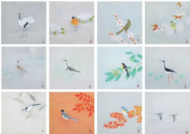
上村淳之《淡交表紙原画》1993年 個人蔵[前期展示]