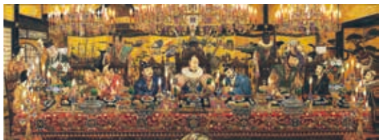
戸倉英雄《信長の晩餐》2014年 個人蔵[通期展示]