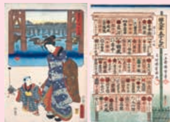
歌川国貞(三代豊国)・歌川広重(初代) 《双筆五十三次》より「目録」「日本橋」1854年 当館寄託(吉澤コレクション) [後期展示]