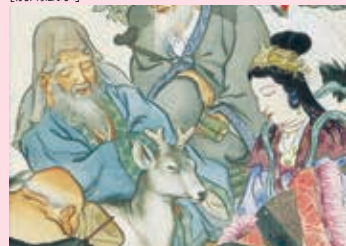
北沢楽天《国利々々眠福》 当館寄託(吉澤コレクション)(部分) [前期展示]