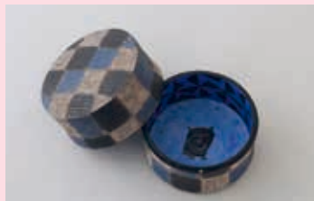
前田正博《色絵銀彩蓋物》2011年 当館寄託(吉澤コレクション) [前期展示]