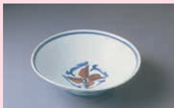
富本憲吉《染付辰砂四分花模様大鉢》1935年 当館所蔵(吉澤コレクション) [後期展示]

絵画や工芸作品には、複数の画面やモチーフがセットとなって成立するものがあります。本展はこの点に注目し、セットならではの面白さや工夫を楽しむ展覧会です。