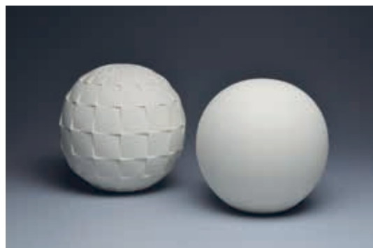
和田的《白器 太陽と月》2022年 当館寄託(吉澤コレクション)[通期展示]