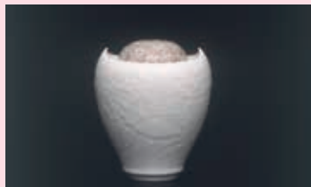
齊藤勝美《葆光彩磁燭花文香炉》2010年 当館寄託(吉澤コレクション) [後期展示]