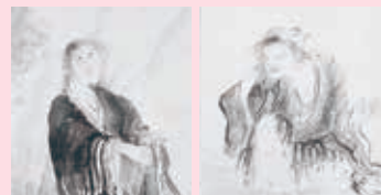
石井林響《蝦蟇仙人・鉄拐仙人》1911年 当館所蔵(吉澤コレクション)(部分) [後期展示]

【会期中の催し物】 状況により変更になる場合があります。他にもイベントを企画しています。最新情報は当館HP・Instagram等でご確認ください。