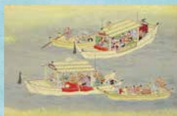
無款《江戸名所絵巻》下巻(部分)