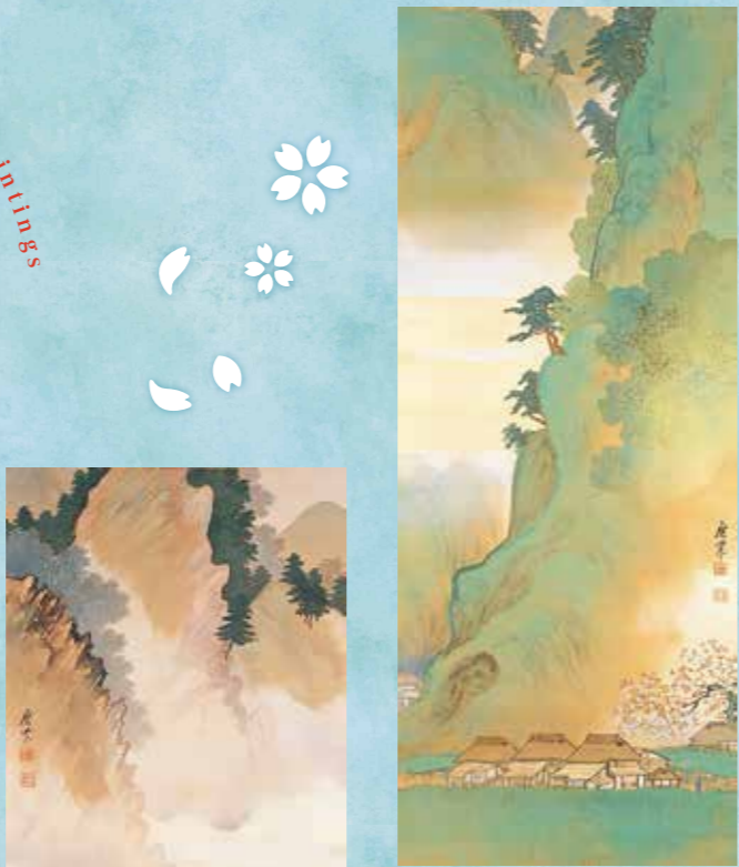
寺崎広業《四季山水》当館蔵