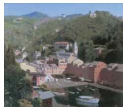
中村清治《ポルトフィーノ風景》