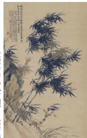
渡辺華山《風竹図》当館寄託