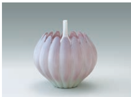
齊藤勝美《葆光彩磁香炉「掌華」》当館寄託