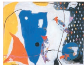
高間恕七《紅冠鳥（幸）》

コレクションの中から動物たちが大集合！美術館が動物園に！？この展覧会では絵画・工芸作品にあらわされた動物たちが主役です。私たちにとって身近な存在であり、美術においても重要なモチーフである動物たち。さまざまな造形、表情を見せる個性豊かな動物表現の魅力に迫ります。