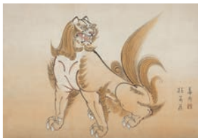
岡田華郷《獅子》当館寄託