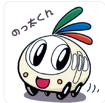
市営バスキャラクターデザイン 「のっ太くん」