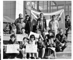
前回優勝の植野支部