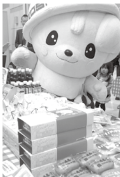
「さのまる」を先頭とした シティプロモーションや 佐野ブランドの確立

本市が取り組んでいる「観光立市」「シティプロモーション」の取り組みや「企業誘致」を評価いただきました。