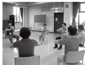
本紙11ページでは「介護予防教室」をご案内しています