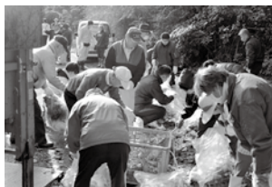
唐沢山の地元町会によるゴミ拾い活動

※次ページでは「まちなかの活性化」「中山間地域の活性化」への取り組みとして、地域おこし協力隊員をご紹介します。