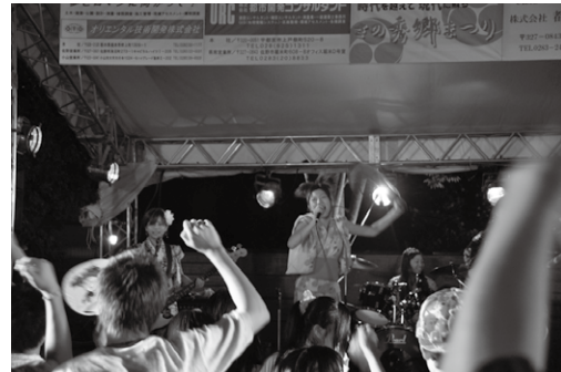
8日(土)・9日(日)駅前ステージ