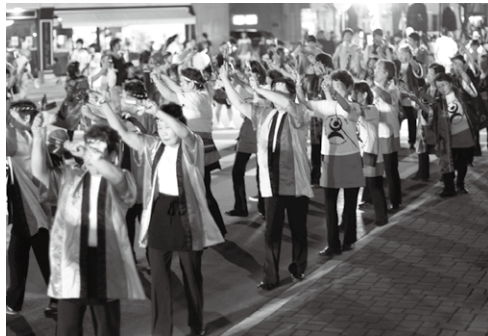
8日(土)市民総おどり