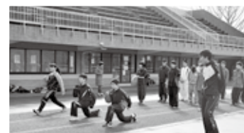
平成28年に開催したジュニア陸上教室

競技力の向上を目指す選手・指導者を育成するための教室を開催しているほか、スポーツで顕著な功績のあった個人や団体を「スポーツ賞」や「ジュニアスポーツ賞」として表彰し、選手の意欲を高めています。