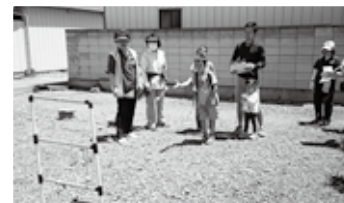
佐野ウォークラリー大会

より多くの方にスポーツに親しんでもらえるよう、「さのマラソン大会」などのスポーツイベントや、スポーツ教室を開催しています。また、「市民歩け歩け大会」や「佐野ウォークラリー大会」など、年齢や体力を問わずに気軽に参加できるレクリエーション大会も開催しています。