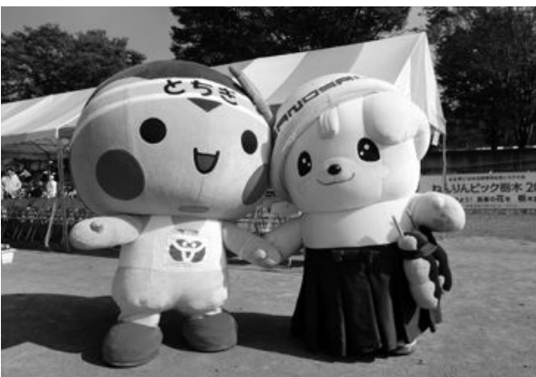
さのまる・とちまるくんは大会を応援します!

ゲートボール交流大会 in 佐野市 平成26年10月5日(日)～6日(月) 会場: 田沼グリーンスポーツセンター