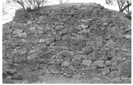
←唐沢山城跡PRキャラクター からまる・からちゃん