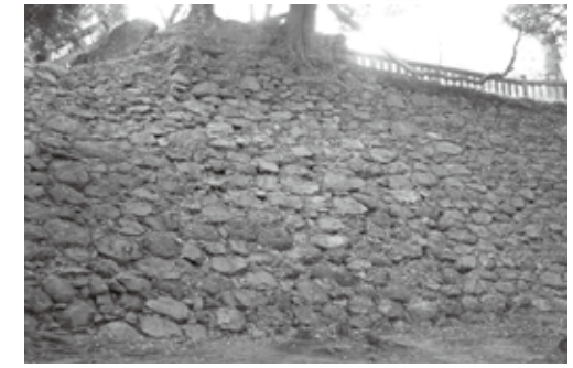
肥前名護屋城跡と唐沢山城跡の石垣です。皆さんは見分けられますか?