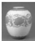
板谷波山 《色切磁 牡丹文様花瓶》

の板谷波山による作品約30点（初公開作品含む）を一堂にご覧いただけます。初めての機会です。50回忌を迎えるこの時に、清らかな作品世界に接していただけたら幸いです。