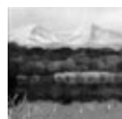
奥田元宋 《磐梯初秋》