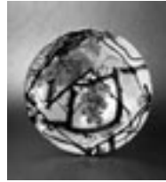
鉄絵銅彩葡萄酒陶板