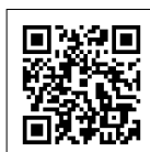
モバイル版ホームページ