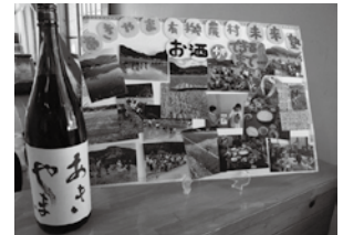
※稲刈りイベントに参加した皆さん。この酒米をもとに地酒「あきやま」を作りました。