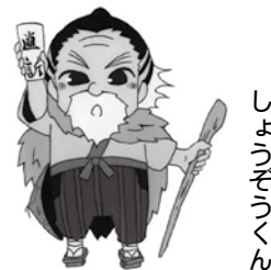
しやうぞうじゆん