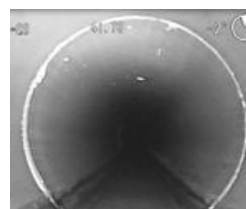
正常な下水管きよ