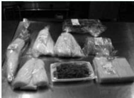
▲新鮮で安心・安全な農産物

今後も、消費者の望む新鮮で安心・安全な農産物を生産することで、食育推進に協力していきたいと思っています。