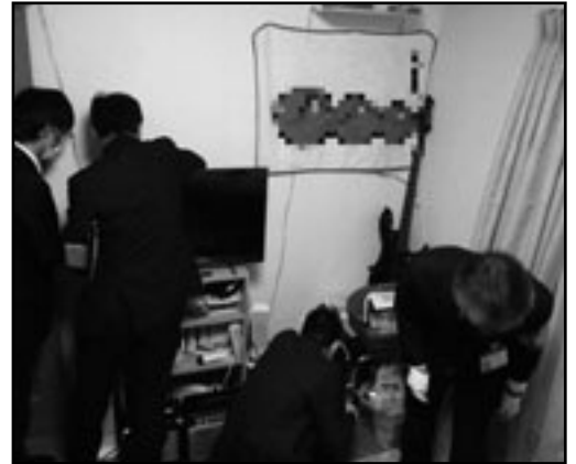
▼ 検索による財産調査の様子