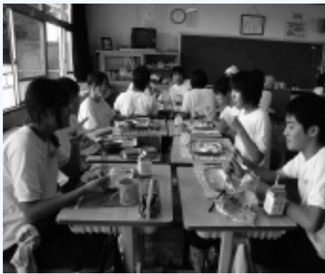
▲城東中学校の給食風景

夏休み中には、朝食の大切さを知り、生徒自身でも手軽に調理できるように、「朝食メニュー料理教室」を中学校を中心に実施しています。また、同時期に実施している「家族料理教室」では、給食の人気メニューを親子で楽しく調理するなど、とても好評なイベントです。