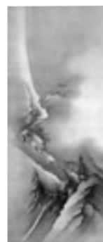
橋本雅邦「溪靄群鴉」