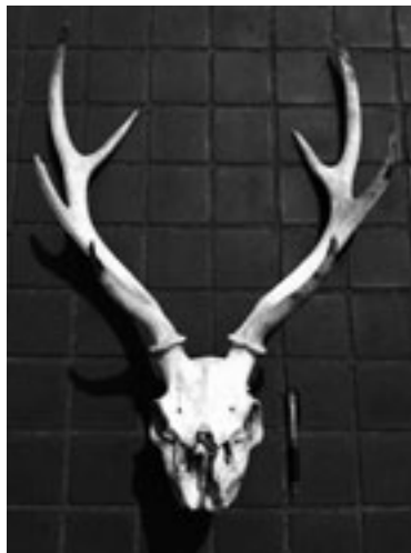
ニホンジカの頭骨

になく、色も白くなっています。鼻先の部分が欠けてしまっていますが、角が立派な雄鹿だったようです。今後クリーニング・消毒などをして、7月下旬ごろから展示する予定です。 とうご期待!