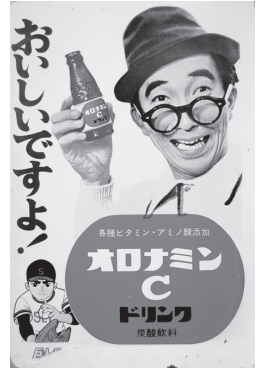
▲懐かしいホーロー看板

本企画展では、佐野ゆかりの看板やホーロー看板など約160点を展示しています。レトロ感満載の看板の世界をどうぞお楽しみください。