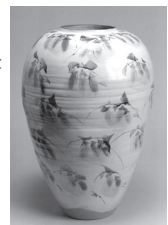
▲鉄絵銅彩ほたるぶくろ文大壺