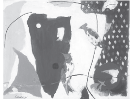
▲高間惣七 《紅冠鳥 (幸)》