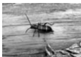
ビャクシンカミキリ

また市内で発見され、県内では珍しいビャクシンカミキリも紹介します。たくさんの方のご来館をお待ちしています。