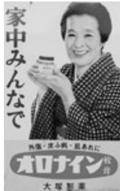
▲懐かしい ホーロー看板

昔から「広告媒体」として活用されてきた看板。人々の関心を惹きつけるために凝らした工夫は、今に生きる人々も魅了します。そんな市内に残る古い看板を紹介いたします。