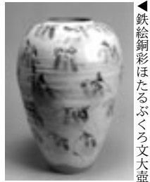
鉄絵銅彩はたるぶくろ文大壺

よいものができた喜び 何ものにも替えがたく ただウロウロ 生きることの尊さを知る 文: 田村耕一