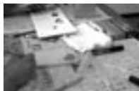
▲去年の講座の様子