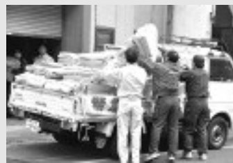
東日本大震災の際の支援物資輸送