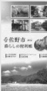
「暮らしのガイド(仮)」