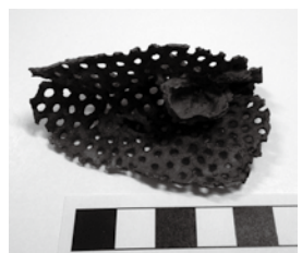
佐野市産コケムシの化石

昨年度一年間と本年度上半期に寄贈された標本を展示します。レースのような佐野市産のコケムシの化石や単弓類の歯の化石複製模型をはじめとして珍しい化石や石を紹介します。