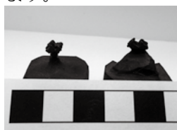
トリティロドンの歯(複製)