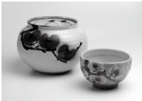
椿 文 水 茶 指 碗