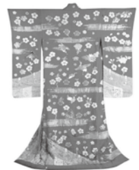
歌舞伎衣裳 「裃(うちかけ)」