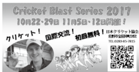
ブラストシリーズはクリケット初心者でも楽しめるイベントです。QRコードからアクセスし、お申し込みください。

クリケットは、「途中にティータイムの時間があり、1日かけて試合を行う紳士のスポーツ」という印象を持つ方が多いようですが、近年では子どもでも楽しめるように工夫したゲームも行われています。基本的なルールはそのままに、投球数を少なくして試合時間を短縮する、ボールを軟式にして防具を不要にするなどの工夫がされています。クリケットが盛んな国の子どもたちも、自分たちでルールをアレンジして空き地で遊んでいます。