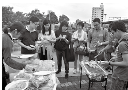
7月には、ムスリムの方が食べられるように処理された食材を使い、「両毛ハラールBBQパーティー」を開催しました。

両毛ムスリムインバウンド推進協議会は、ムスリムの皆さんに佐野市を十分に楽しんでもらいたいという思いを持って組織されました。そして、イスラム圏の国々の将来性や可能性に着目し、佐野市のPR活動なども行っています。