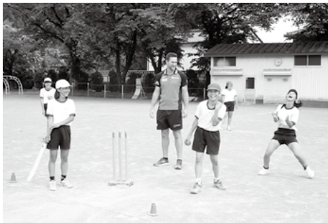
クリケット協会の普及活動(赤見小学校にて)

世界全体では、野球より競技人口が多く、サッカーに次ぐ世界第2位と言われ、プロリーグでは、10万人を超えるスタジアムでワールドカップが開催されるメジャースポーツです。国内の競技人口は約3千人でまだまだマイナーなスポーツですが、日本クリケット協会は、日本のクリケットの聖地「クリケットのまち佐野」を目指し、その普及と発展のため、活動しています。