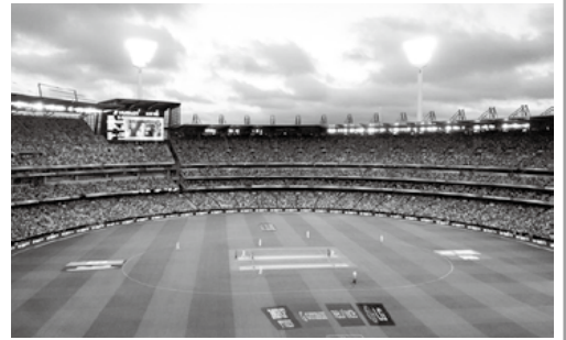
W杯で盛り上がるオーストラリアの競技場

世界第2位と言われ、プロリーグでは、10万人を超えるスタジアムでワールドカップが開催されるメジャースポーツです。国内の競技人口は約3千人でまだまだマイナーなスポーツですが、日本クリケット協会は、日本のクリケットの聖地「クリケットのまち佐野」を目指し、その普及と発展のため、活動しています。