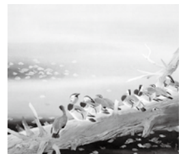
《霜の朝》宇都宮美術館蔵

運氣上昇！新春スタンプラリー 吉澤記念美術館、葛生化石館、葛生伝承館、郷土博物館で 干支やお正月にちなんだ作品を展示します。全館のスタンプを集めた方に、素敵なプレゼ ントを贈呈します(先着順)。▶ 期間 = 1月5日(火)～2月21日(日) ※休館日を除く