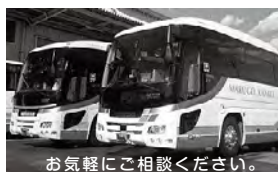
お気軽にご相談ください。

バス旅なら楽しく楽ちん。運転の心配もなく目的地に到着。気の合うお仲間と思いい出作りにぜひご利用ください。各種送迎も承ります。